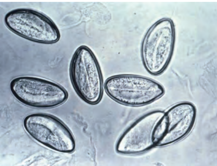
تخم کرم‌ها اندازه طبیعی: 20 \times 60 میکرومتر

در صورت تشخیص آلودگی و عفونت انگلی از سوی پزشک، باید مداوا حتماً با استفاده از یک داروی ضد انگل (باصطلاح داروهای انتهلیمینتیک) صورت بگیرد. ترکیبات فعال در داروهای انتهلیمینتیک طی سالهای متمادی تأثیر مفید خود را باثبات رسانده اند و ارگانسیم بدن آنها را به خوبی تحمل می‌کند. این داروها در بدن جذب نمی‌شوند و تنها کرم‌های انگلی در دستگاه گوارشی را مورد حمله قرار می‌دهند. بی‌عارضگی این داروها یکی از صفات متمایز کننده آنها نسبت به سایر ترکیبات فعال در داروهای دیگر است. برای اطلاعات بیشتر به پزشک خود مراجعه کنید.